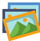
Doel van de afbeeldingen