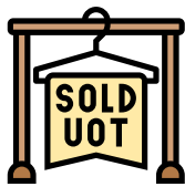
Procedure bij uitgeputte voorraad