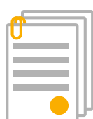
Officiële benaming en rechtsvorm

Deze informatie moet ALTIJD aanwezig en toegankelijk zijn voor al jouw websitebezoekers ongeacht de aard van je website.