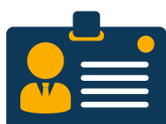
Ondernemingsnummer en/of BTW-nummer