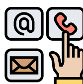
Contactgegevens (e-mail, tel en adres)